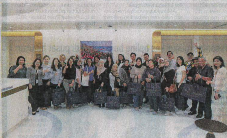
Pengamal media dibawa menyertai lawatan berpandu di Pusat Perubatan Prince Court pada Rabu.

"Kami menyokong pesakit bermula mereka masuk ke hospital dengan menyediakan diagnosis tepat menggunakan teknologi terkini hingga pe-