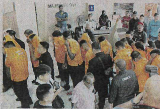
Kesemua 33 individu dibawa ke Mahkamah Majistret George Town untuk perintah reman pada pagi Rabu.