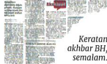
Keratan akhbar BH, semalam.