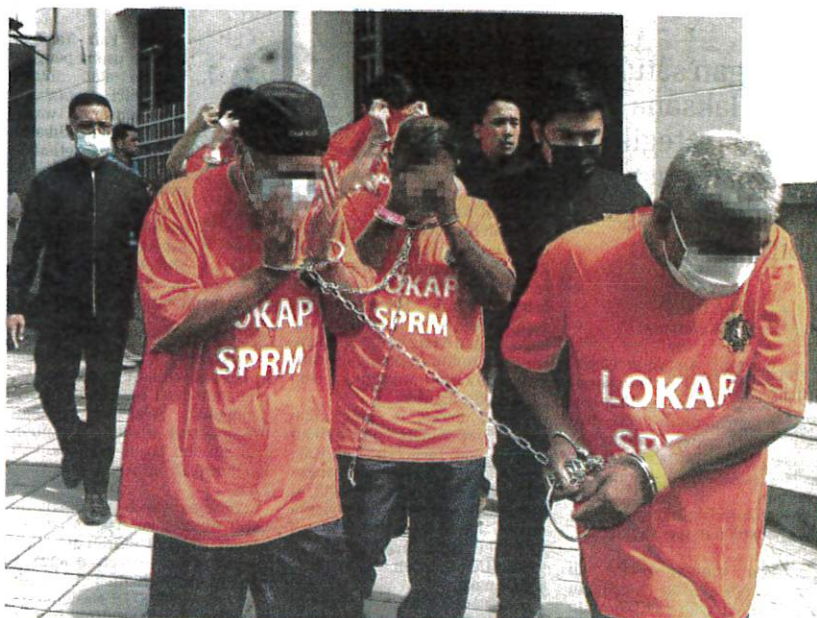
Tiga doktor kanan dibawa keluar dari Kompleks Mahkamah Georgetown, semalam.

"Kebanyakan mereka membuat tuntutan palsu atas alasan kecederaan 'Ligamen Anterior