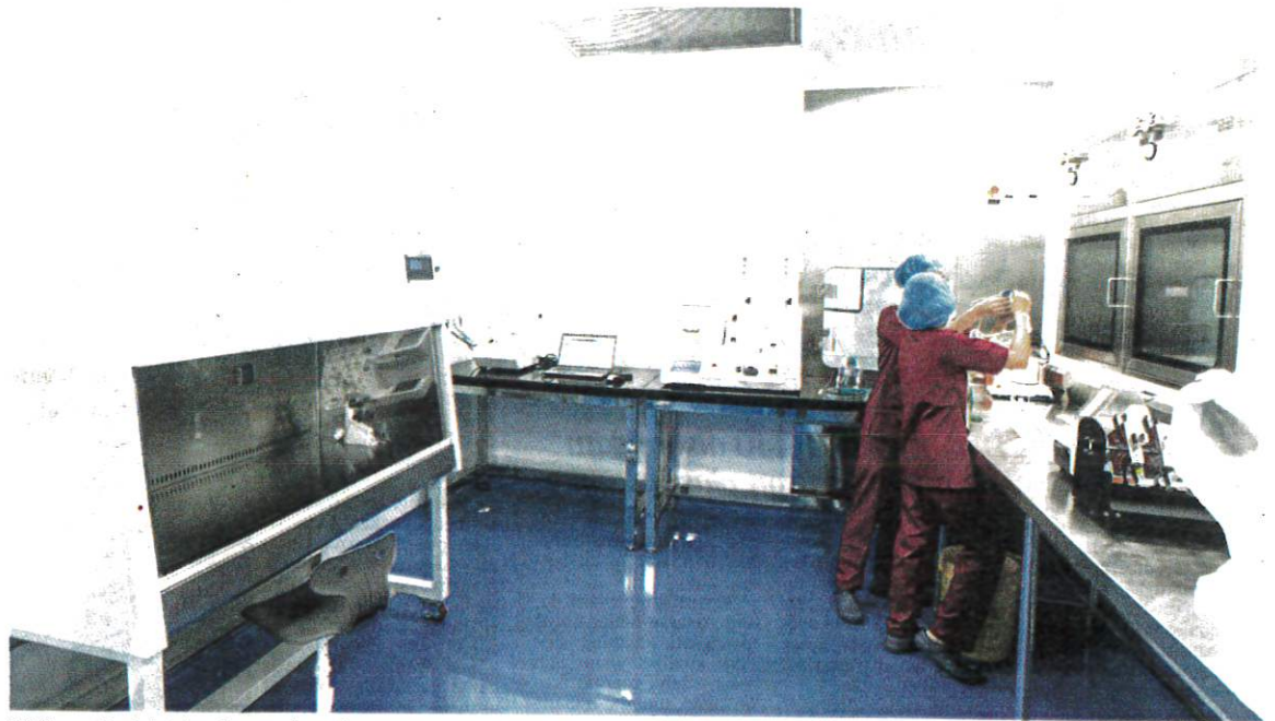
SEJAK merdeka hala tuju sektor perubatan kita semakin baik malah sistem kesihatan diperakui antara yang terbaik di dunia.

“Kita sudah mula ada menerima pelajar-pelajar