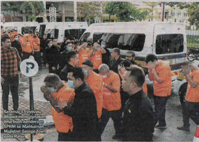
Seramai 33 individu dibawa menggunakan lima buah kenderaan SPRM ke Mahkamah Majlstrat George Town pada Rabu.